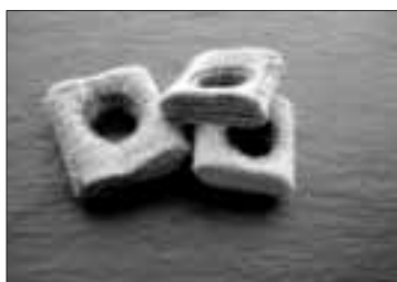
Un diseño de Maribel Aramendía.