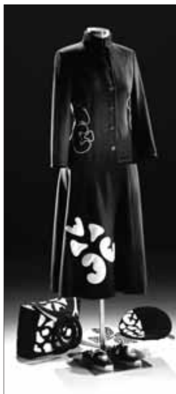
Un conjunto diseñado por el taller Dexartu Diseño Textil.

Cuatro exposiciones abren este fin de semana en Pamplona. Tres están dedicadas al arte y otra a los talleres artesanos y los diseñadores