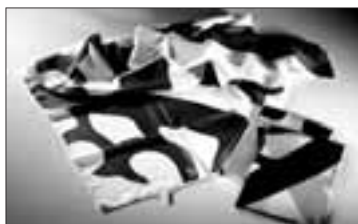
Pañueños de Aziza Puch.