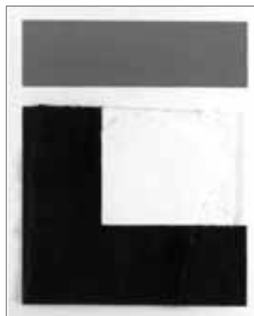
Una de las obras que presenta Rafael Canogar.