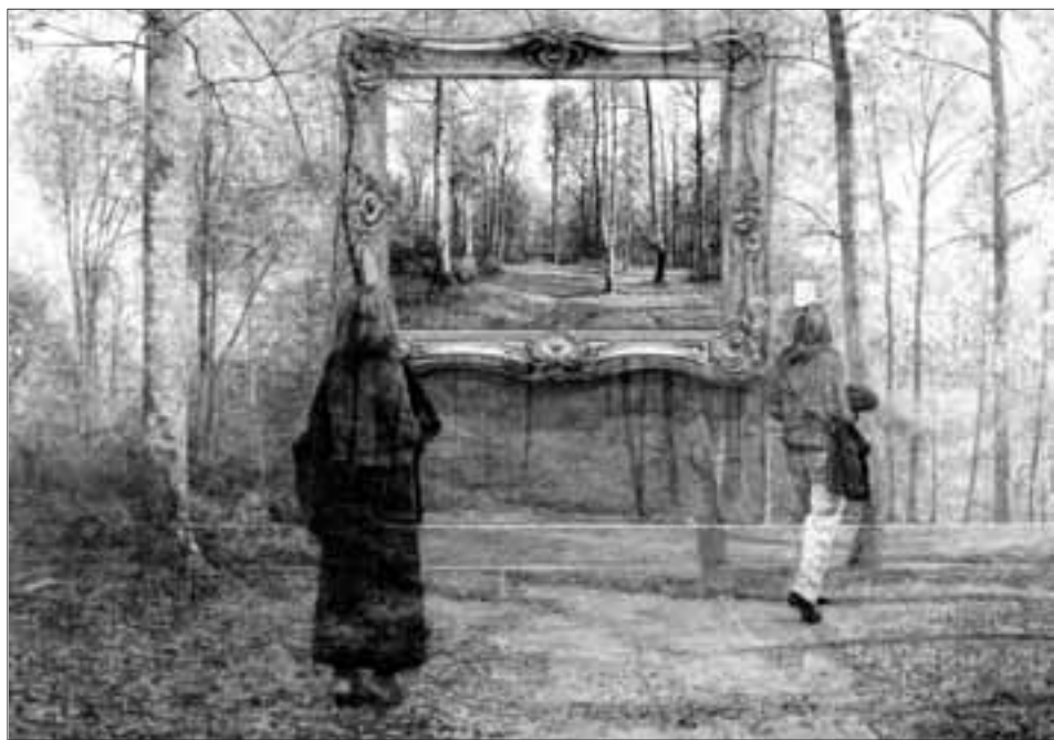
¿Quién posee el copyright?, una obra de Juan Antonio Falcó.