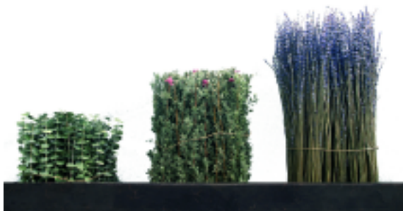
Jardín de Santiago, Karmele Sarrias

Hay más de 30 piezas que han buscado en nuestra personalidad y nuestras formas de representar la realidad a lo largo de la historia para reinterpretarlas desde el siglo XXI y elaborarlas con mimo artesano.